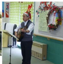
みんなでハイチーズ！