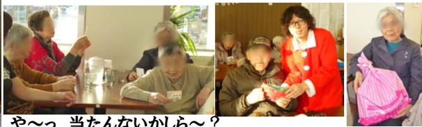
や〜っ 当たんないかしら〜？