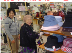
おしゃれ帽子は・・・と