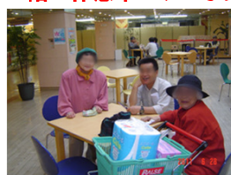
7階で休憩中です・・・ふう