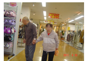
せんべいは・・・どこだ？