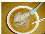
美味しそう・・・

やはり皆さんラーメンが大好きなんですね。残さずに食されました。味噌・醤油・塩全て美味しかったです。ニングルさんありがとう。