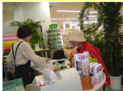
会計中です・・・