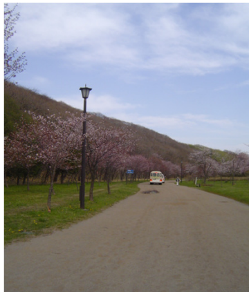
金太郎池には、長～～～い桜並木道があります。