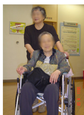
二人仲良く買い物♪