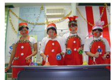
職員のハンドベル