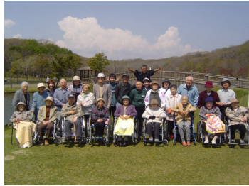
わかくさ定番 「いち + いち は〜?」 「に〜」

今年もわかくさでは、お花見に金太郎の池に行きました。例年より開花が早く、GW中がピークだった為、残念ながら満開の桜を見ることはできませんでしたがお弁当を持って、ピクニック気分を味わってきました。