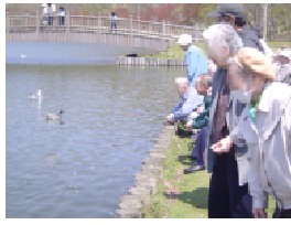
おいでおいで〜！ パンあげるとよ〜