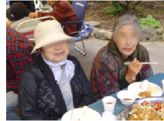
みなさん「お腹いっぱい!!」と口々におっしゃってましたね〜