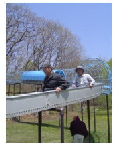
童心に帰ってみたいですね