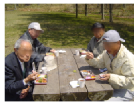
外でみんなで食べると、美味しいっ

6月には、職人さんによる実演で、手打ちそばを昼食で頂きました。打ちたてはやっぱり美味しかったですね〜。