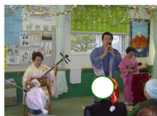
白老民謡の皆さん