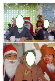
サンタさん、トナカイ と記念撮影