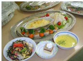
今年も豪華な食事を用意しました ボリュームも味も最高でしたわ