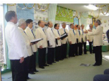
男性合唱団 「コールボイジャー」 すごい声量でしたわ