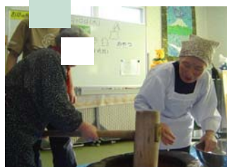
「ヨイショ・コラショ」 「ハイよっ・ソラよっ」