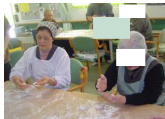
「つきたて美味しそう」 「食べちゃう??」