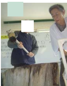
「よ〜しこ〜い！！」 「ぞらきた〜！！」