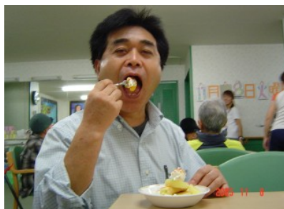
一番美味しそうに食べてま〜す。あ〜ん！バクッ