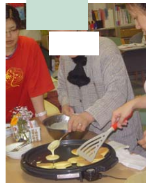
美味しく焼けるかしら??