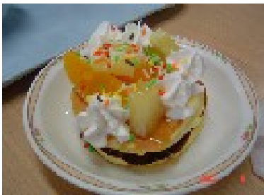
みんなで作った力作です♪

手作りおやつで“ホットケーキ”を作りました。飾り付けは一人一人されました。一部紹介しま〜す