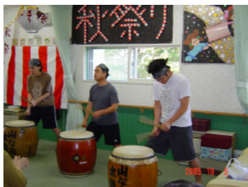
迫力満点!! 皆さんにも喜んで頂けました。