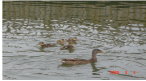
今年の夏、わかさでは初めて外出しました。