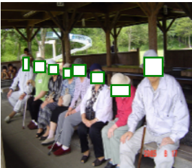
あづまやでホッとひと休み・・・