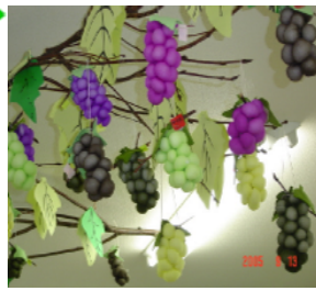
もいで食べちゃいたいくらい 本物ぞっくりでした