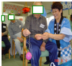
ヨ-ヨ-たくさん釣れたかな..?