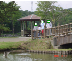
う～んっ いい眺めだなあ