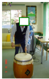
どうだっ この響き!