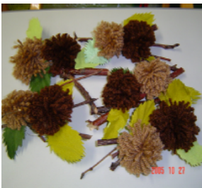
栗ご飯にしようかな～？