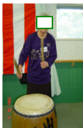
なかなかいい音がするね

お陰様で「デイサービスわかさ」も10月1日で2周年を迎え、秋祭りを開催しました。