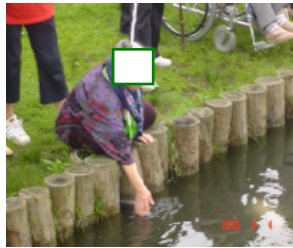
「鯉さん おいでおいで」