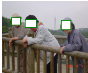
たまにはこんな散歩もいいですねえ・・・